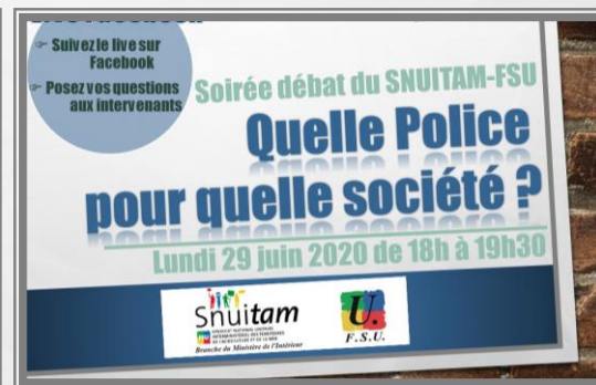
VISUEL DU 29 JUIN