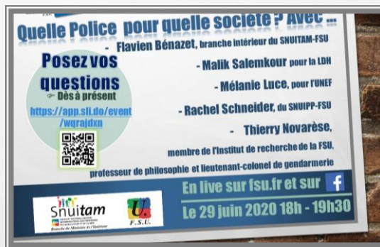
VISUEL DU 26 JUIN